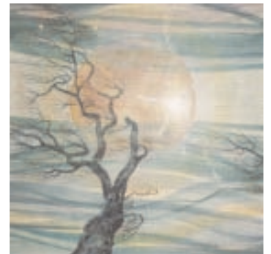
Luna llena - cambio del tiempo Aquarell 100x100 cm