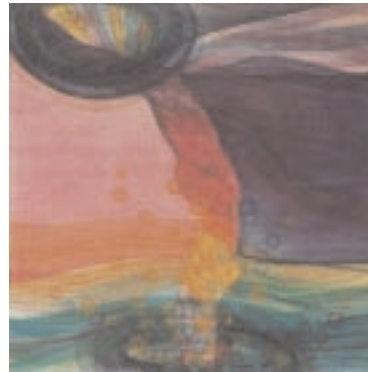
Taifun - viel Wirbel um Isabelle Aquarell 100 x 100 cm