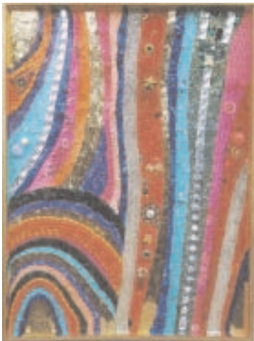
"Maserung" (2001) 62 x 82 cm Collage aus Glas, Kunststoff, Metall