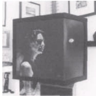
„TOYA EN EL PANTHEON“ 58 x 68 cm T. MIXTA/PAPEL. 2000