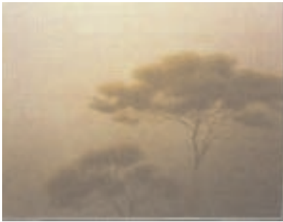
„Pinien“ 110 x 120 cm