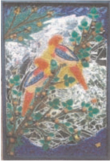
„Los Dos Loros“ (2000) 49 x 71 cm Collage aus Glas-, Spiegel- und Kunststoffbruch