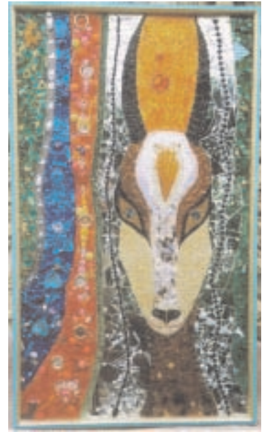
"The Great Impala" (2000) 94 x 160 cm Collage aus Glas, Kunststoff, Metall, Fundobjekten