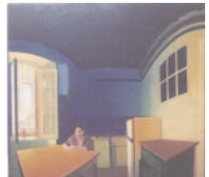
"VIA DE LE GROTTA" 180 x 200 cm O/LIENZO. 1999