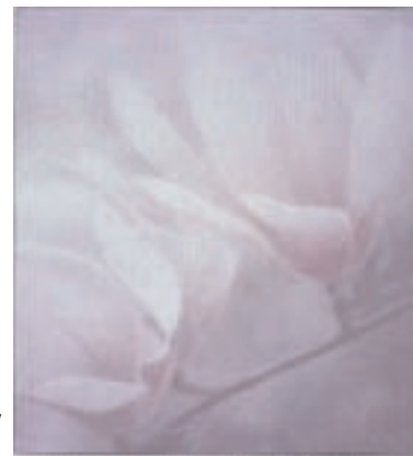
„Magnolia“ 100 x 90 cm

1992 Europ'Art Genf The Allrich Gallery, San Francisco