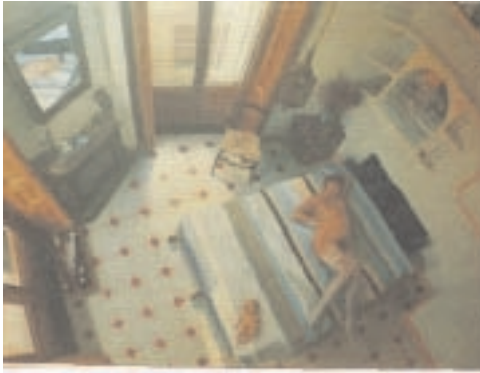
„EL OMBLIGO DEL MUNDO“ 150 x 200 cm ÓLEO/TELA. 1996