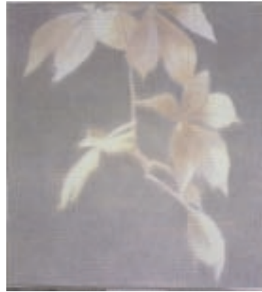
„Laub“ 110 x 100 cm