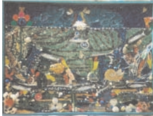
„Fruits de Mer“ (1999) 83 x 63 cm Collage aus Glas, Kunststoff, Muscheln