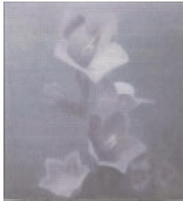
„Campanilla“ 120 x 110 cm