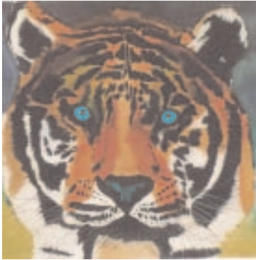
Welthochadels letzte Generation — Königstiger Aquarell 100 x 100 cm