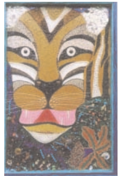
"Der verdutzte Tiger" (2001)

96 x 145 cm Collage aus Glas, Perlmutter, Muscheln