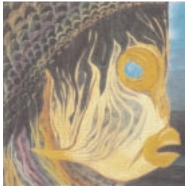
Zebrafisch - Vater Zebra Mutter Fisch Aquarell 100 x 100 cm