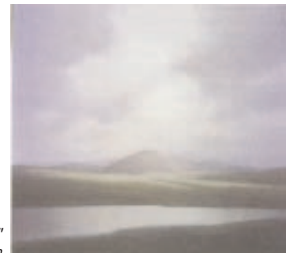
„Highlands“ 110 x 120 cm