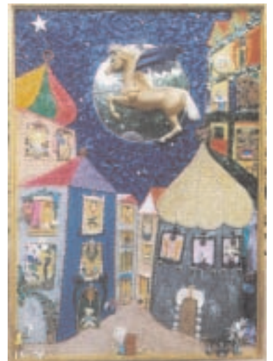
"Vollmond im Pegasus" (2000) 78 x 108cm Collage aus Glas, Kunststoff, Perlen, Fundobjekten